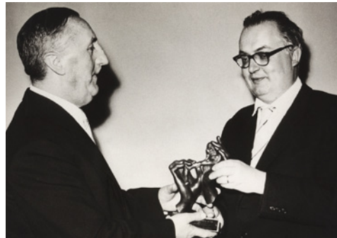
Friedrich Dürrenmatt recevant le prix des aveugles de guerre, 31.05.1957