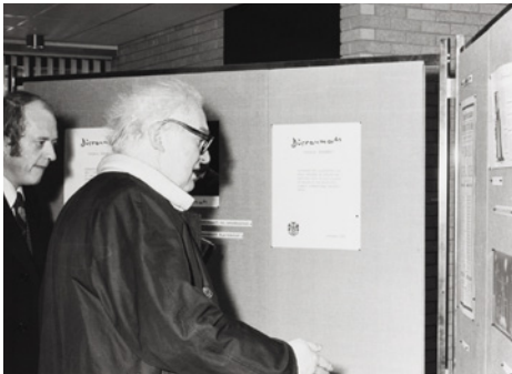
Friedrich Dürrenmatt lors de son voyage au Pays de Galles pour la remise du Welsh Arts Council International Writer's Prize 1976