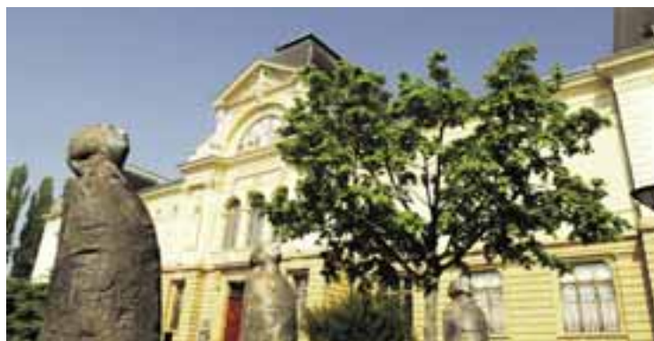
Musée d'Art et d'Histoire, Neuchâtel.