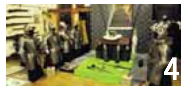
4 Les «féeries militaires» de Plonk&Replonk sont à découvrir samedi 14 mai au Château de Colombier.