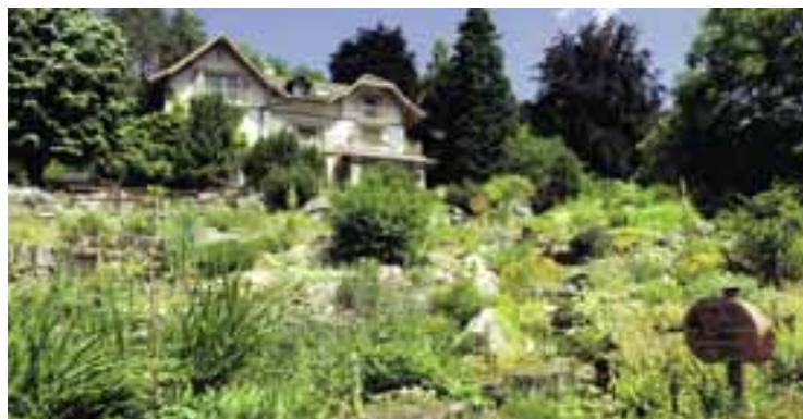
Jardin Botanique, Neuchâtel.