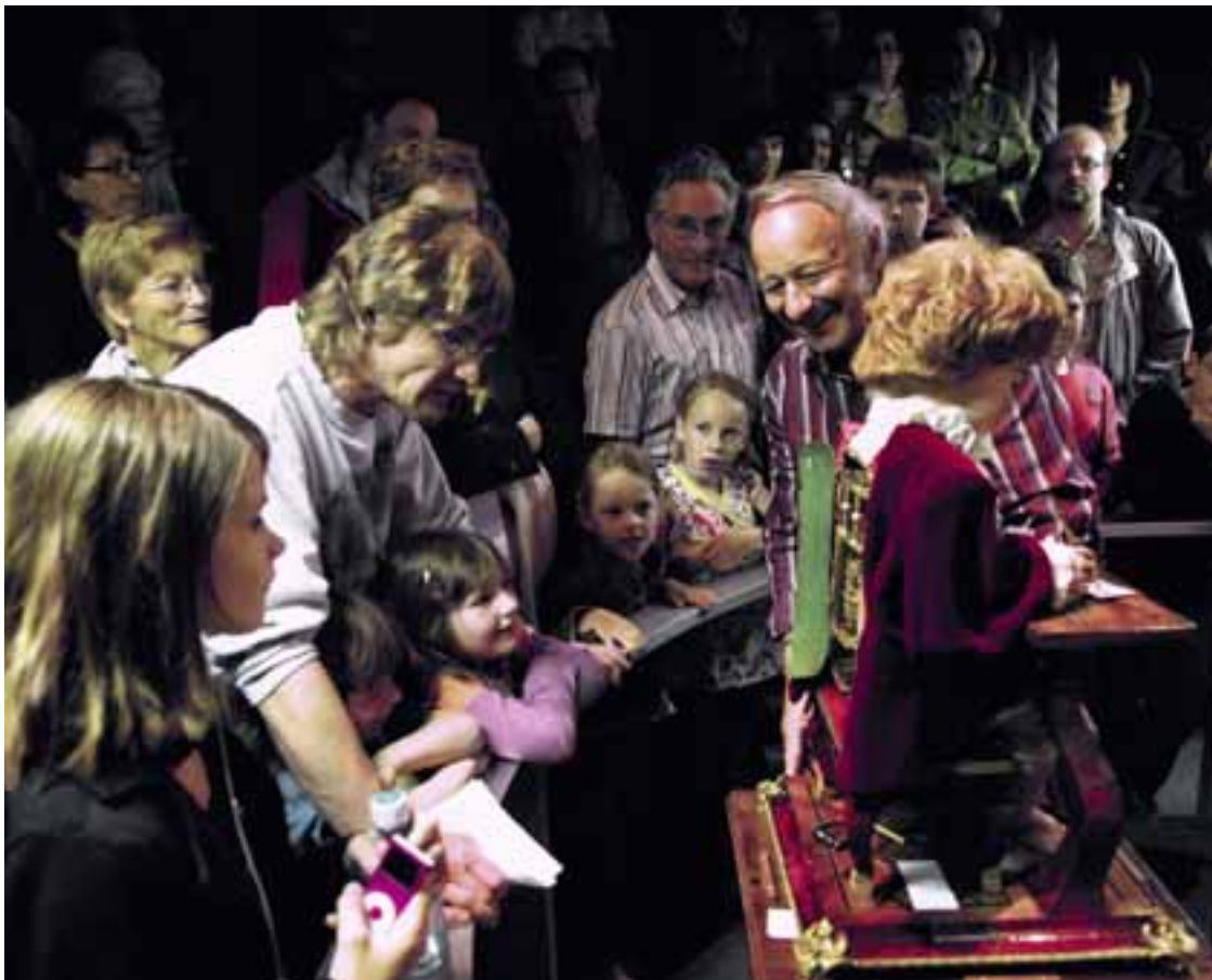
Les trois célèbres automates Jaquet-Droz conservés au MAHN reprendront vie lors de démonstrations publiques. • Photo: archives