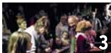
3 Le MAHN organise des visites guidées «éclair» de ses différentes expositions durant la Nuit des musées.

• Programme complet sur www.fetedeladanse.ch www.neuchatelville.ch