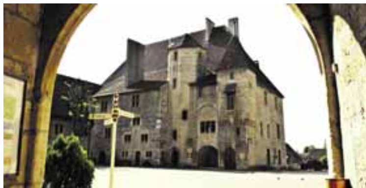
Musée Militaire, Colombier.