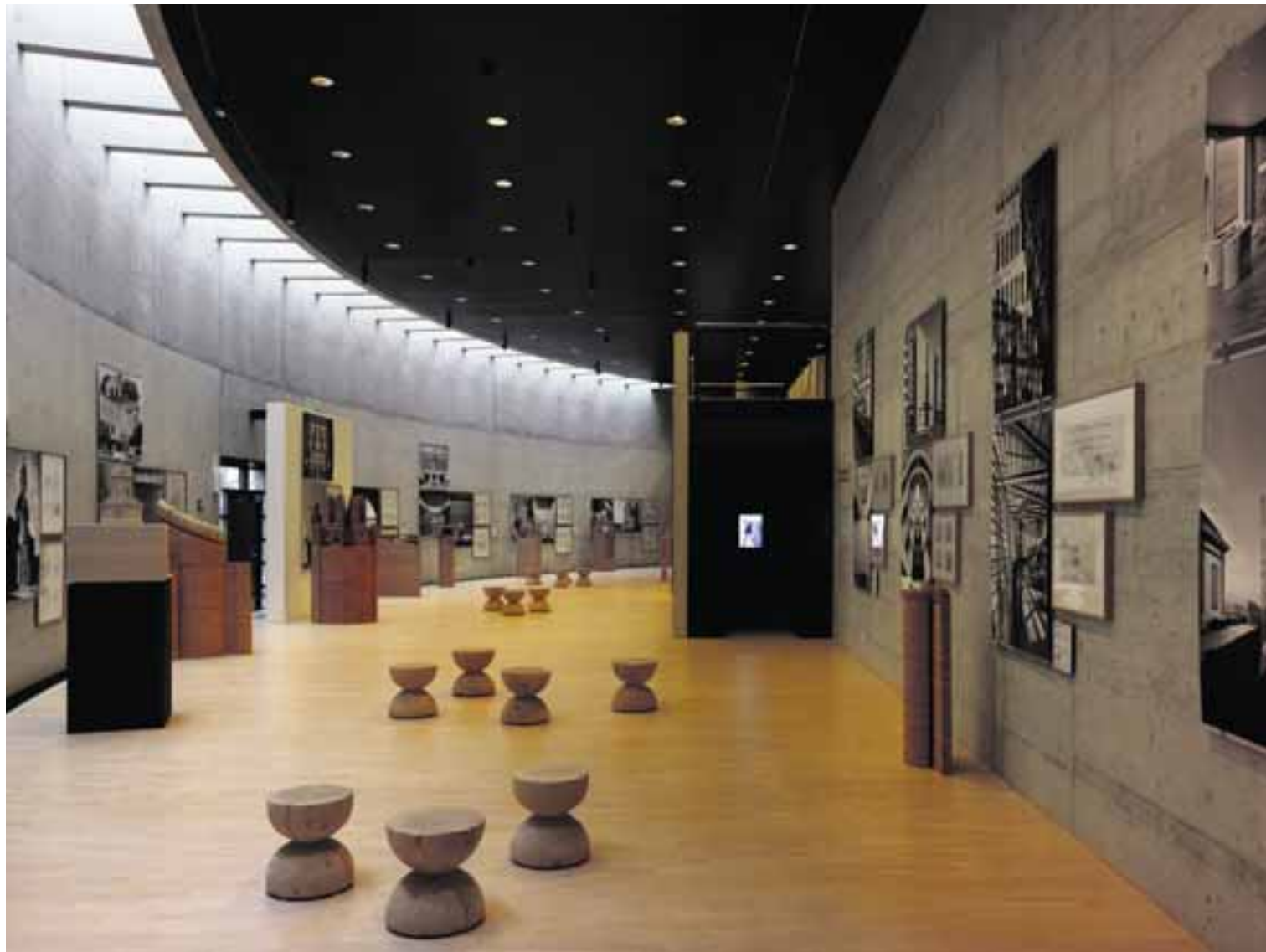
Les maquettes d'architecture de Mario Botta se métamorphosent en décors de théâtre, le temps d'une nuit.

Les maquettes d'architecture de Mario Botta se métamorphosent en décors de théâtre, le temps d'une nuit