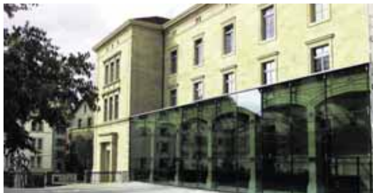
Musée d'Histoire Naturelle, Neuchâtel.