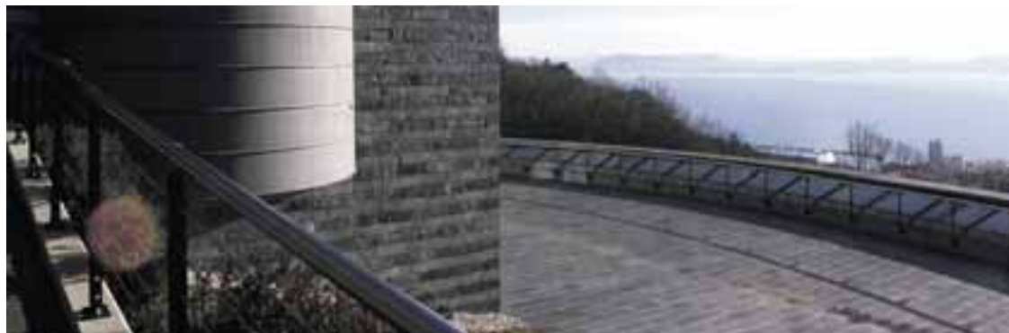
Centre Dürrenmatt, Neuchâtel.

Les musées de la Ville de Neuchâtel, le Centre Dürrenmatt, le Laténium, le Jardin botanique et le Musée militaire de Colombier proposent une série de manifestations samedi 14 mai en l'honneur de la Nuit européenne des musées. Concerts, performances théâtrales et visites guidées sont autant d'activités qui animeront ces espaces culturels le temps d'une soirée. Les enfants ne sont pas oubliés: l'Atelier des musées organise plusieurs animations à leur intention. Renseignements sur www.atelier-des-musees.ch .