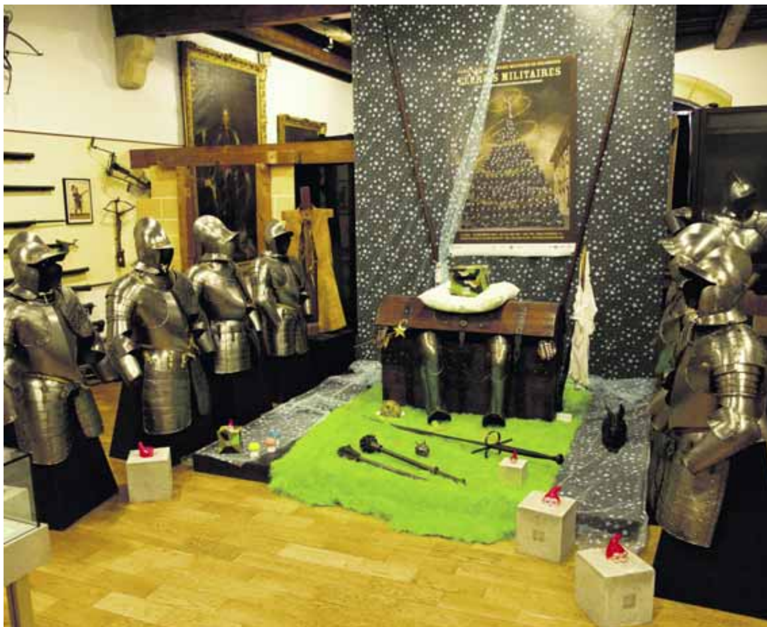
Sur les traces des nains de jardin au monde magique des militaires.

Des pièces de collection détournées, telle cette armure ornée d'un pagne hawaïen, parachèvent l'exposition. Ce monde de contes et légendes insoupçonné est à découvrir gratuitement le samedi 14 mai de 20 à 23 heures et le lendemain de 15 à 17 heures. (ab)