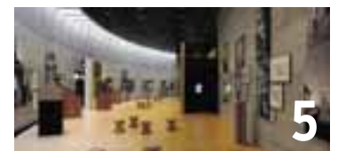
5 Les portes de la bibliothèque personnelle de Friedrich Dürrenmatt s'ouvriront dimanche 15 mai.