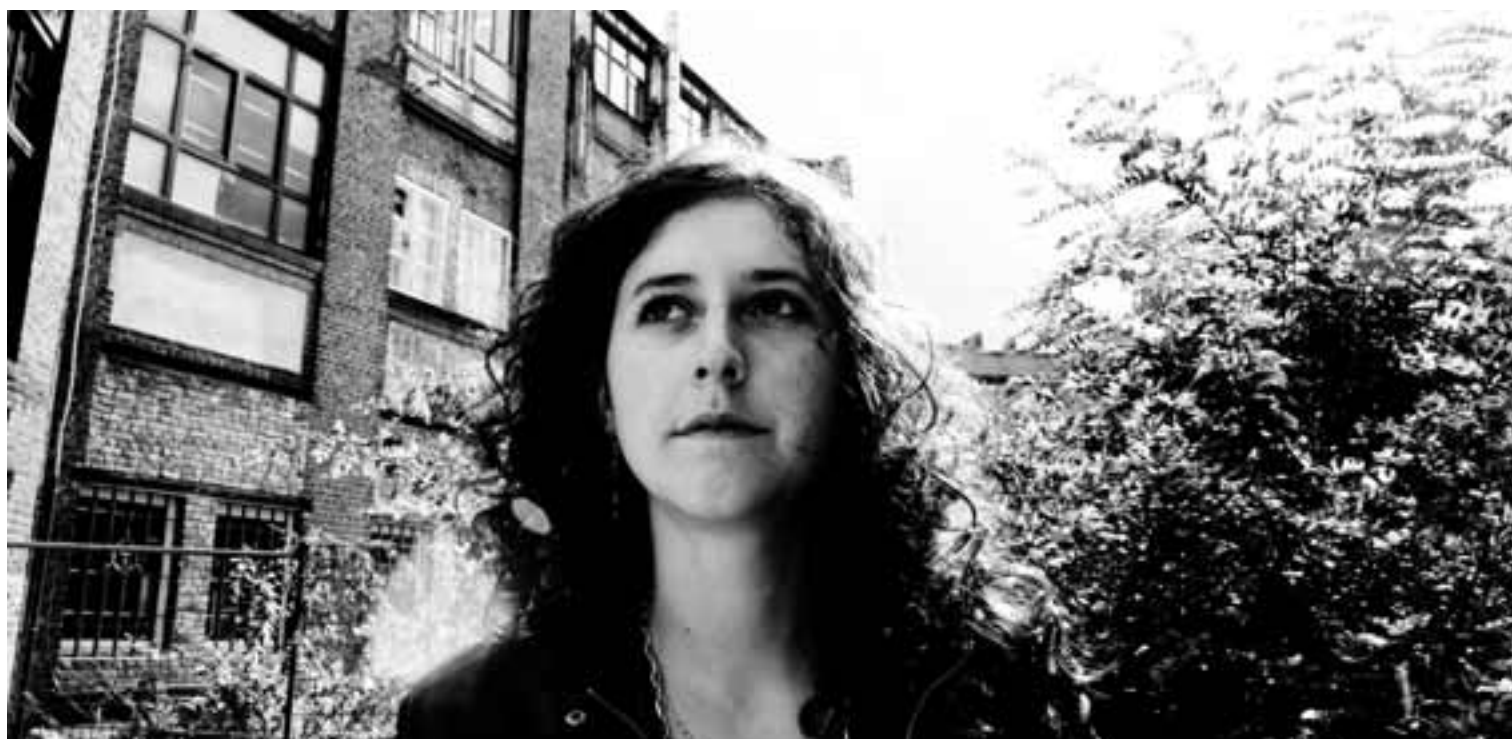
La chanteuse «Kasette» donnera un concert samedi 14 mai à 21 heures au Musée d'ethnographie de Neuchâtel.