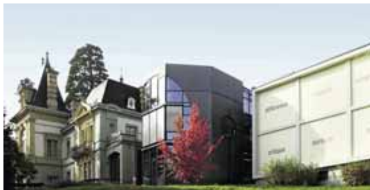
Musée d'ethnographie, Neuchâtel.