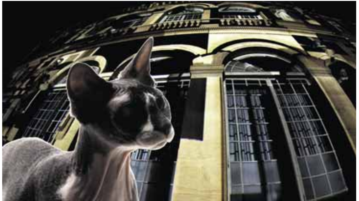
La nuit, tous les chats sont gris... et les souris dansent!